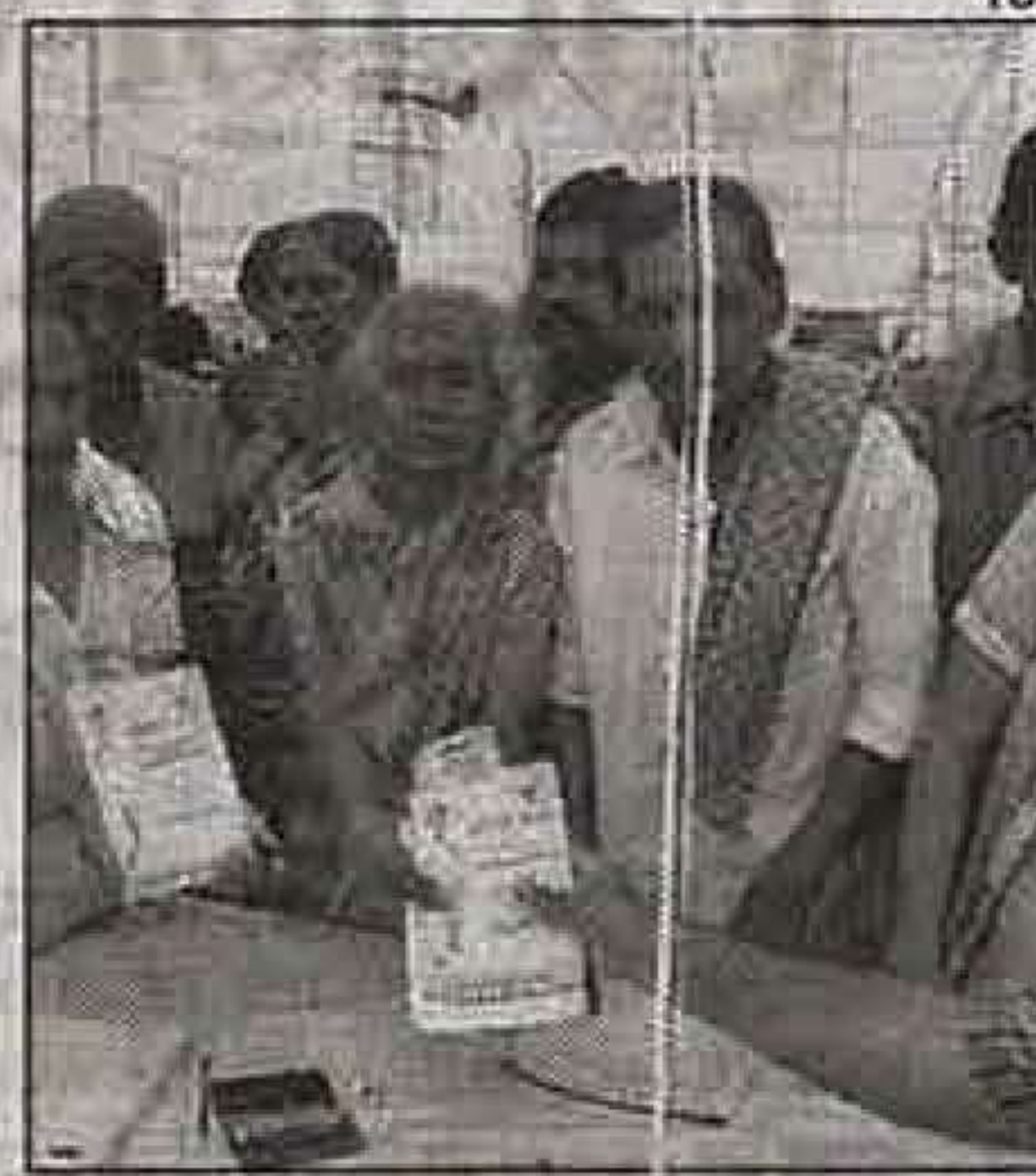
RELIEF AT LAST

tiatives like Ujjwala and Jan Dhan accounts. All add up to social security and financial inclusion.