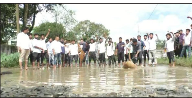
পথৰ অৱস্থা জৰাজীৰ্ণ গৈ পৰিছে। পথসমূহত বৰষুণতে হোৱা গো-বাট সদৃশ বোকায়ে জীয়াত পুখুৰীসদৃশ প্ৰকাণ্ড প্ৰকাণ্ড গাঁত আৰু এজাক এজাক ভোগাই আহিছে সৰ্বসাধাৰণক। বাইক, চাইকেল,