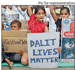
Pic for representation

New Delhi: The CBI investigation in Hathras case, in which a Dalit girl was allegedly brutally raped and died of injuries, is to be monitored by the Allahabad high court and the CRPF would provide security to the victim's family and witnesses in the case, the Supreme Court said Tuesday. The issue of transferring the trial out of Uttar Pradesh would be considered if the need arises in future, apex court said, observing that all aspects of the matter are left open to be considered by the high court. A bench headed by Chief Justice S A Bobde noted in its verdict that Lucknow bench of Allahabad high court has taken note of Hathras incident and passed order directing registration of suo motu petition. "From the order passed by the high court it is noticed that the high court has adequately delved into the aspects relating to the case to secure fair investigation and has also secured the presence of the father, mother, brother and sister-in-law of the victim and appropriate orders are being passed, including securing reports from various quarters," said the bench, also comprising Justices A S Bopanna and V Ramasubramanian. "In that circumstance, we do not find it necessary to di-