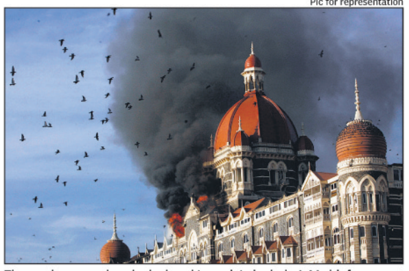
Pic for representation