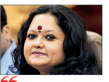
When I joined Facebook in 2011, internet growth in the country was woefully low and I often wondered how social and economic asymmetries will be addressed. We were a small unlisted startup back then guided only by our mission and purpose to connect people in India. After nine long years, I feel that mission has largely been met